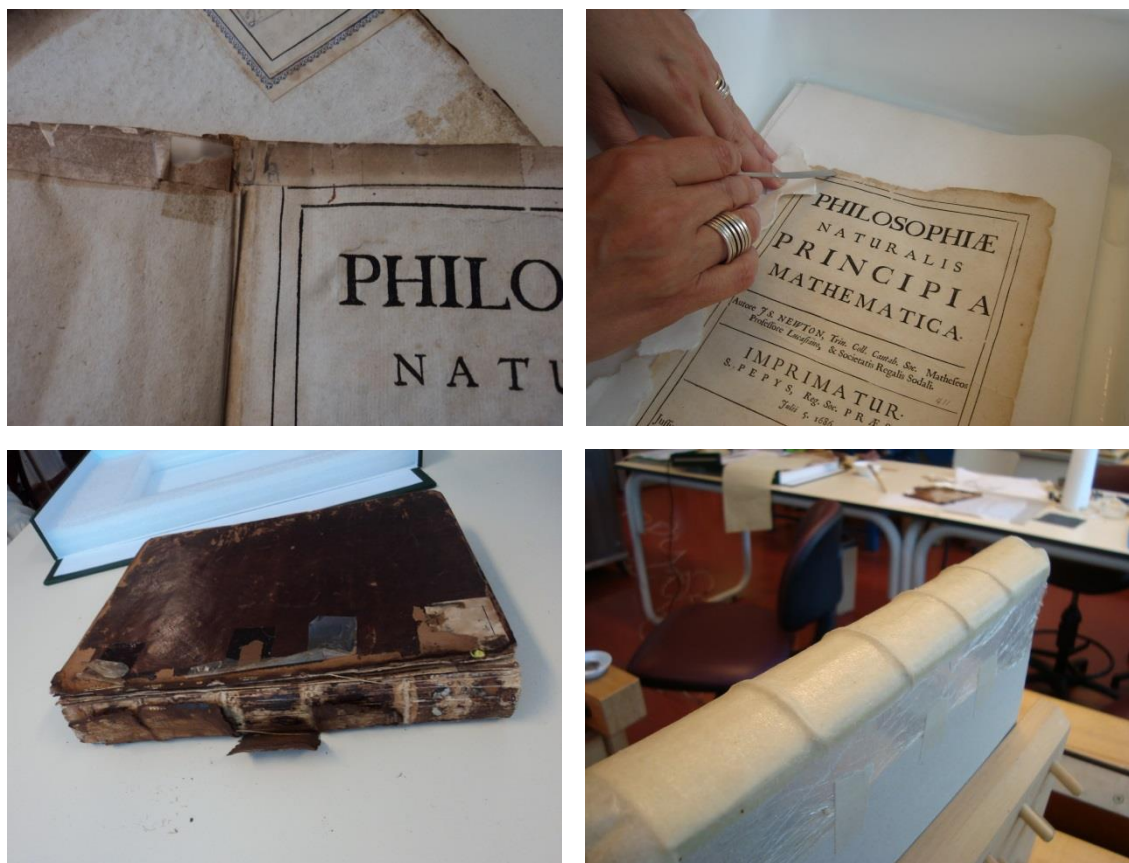
Figura 4: Restauración del Principia (Díaz y Coxe, 2011).

El ejemplar del Principia de la Biblioteca de la FCAG presentaba una cubierta realizada en pleno cuero de cabra deteriorada en lomo y tapas. Éstas últimas se encontraban desprendidas y los deterioros se definían básicamente como desgarros y faltantes. El libro tenía restauraciones anteriores con uso de cinta adhesiva y un importante deterioro en las guardas adheridas a las tapas como consecuencia de la oxidación del cuero en su borde externo. Las guardas volantes, como así también las primeras y últimas hojas se encontraban desvinculadas del resto del bloque; presentando además suciedad superficial, abrasión y roturas que habían sido reparadas con cinta adhesiva en sucesivas intervenciones.