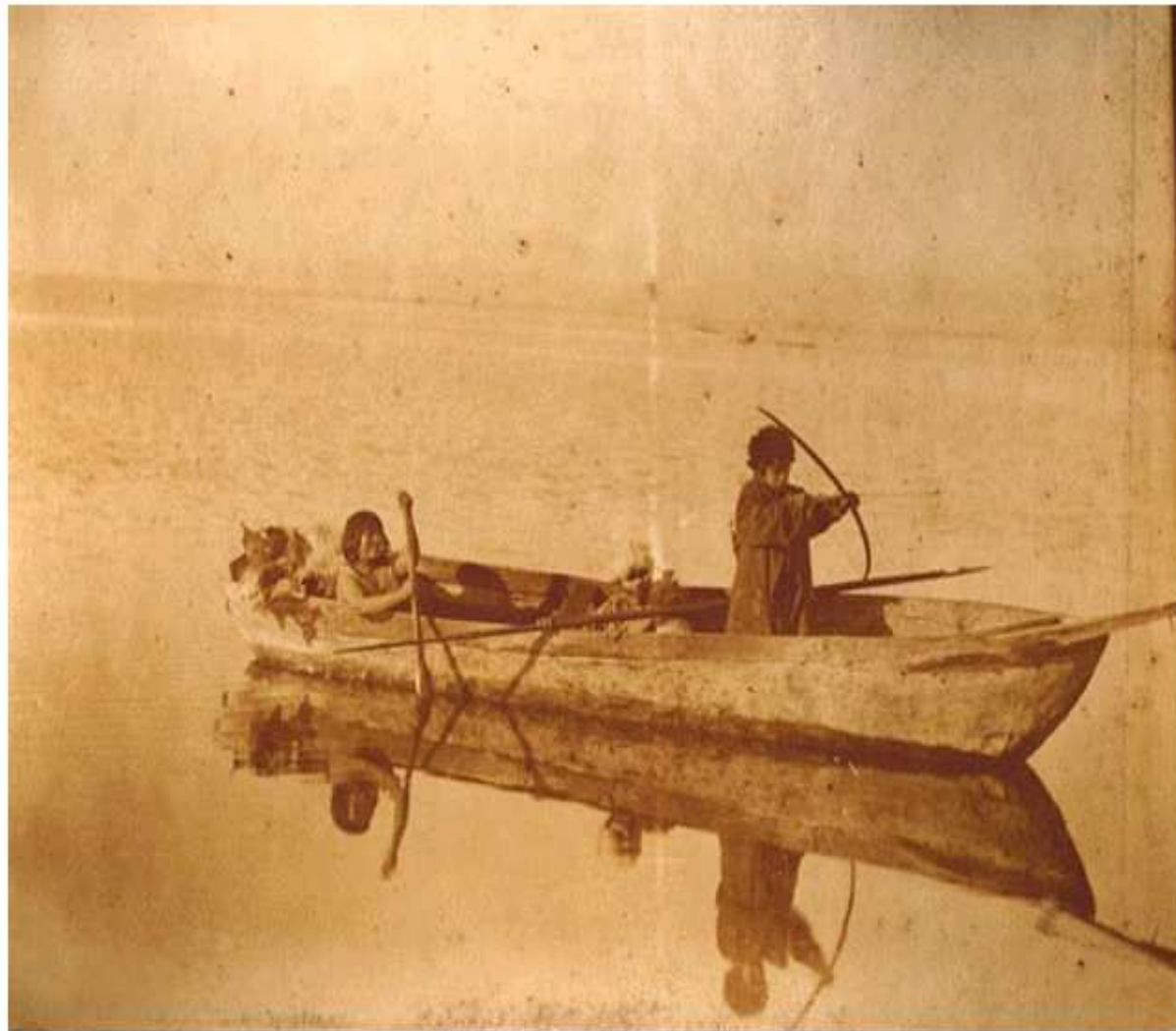
Ushuaia - Canoa de indios en viaje - El Dr. Ala