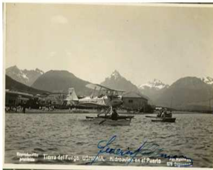
Tierra del Fuego. Ushuaia. Hidroavión en el puerto