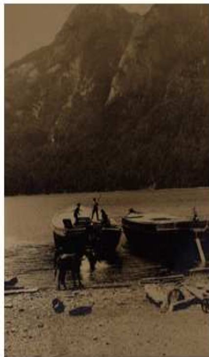
Desembarcando animales en Puerto Blest