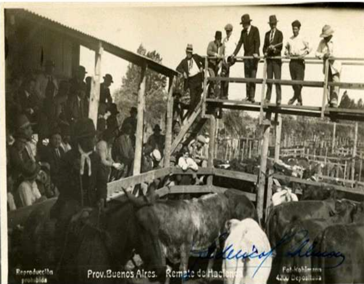
Prov. Buenos Aires. Remate de hacienda