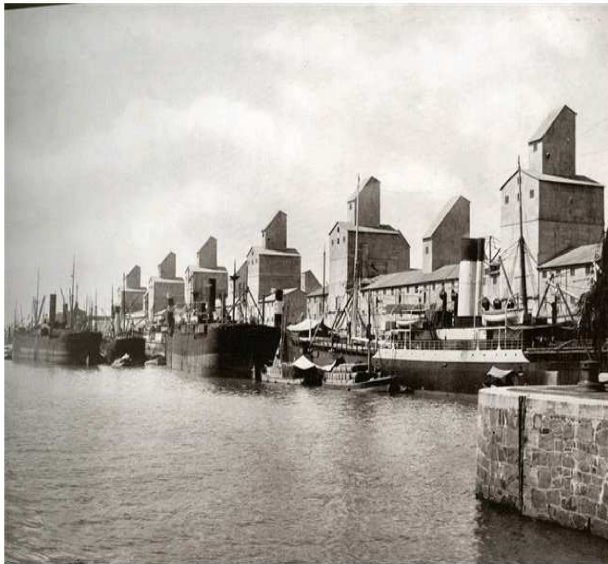
Elevadores de granos

Para la construcción de un nuevo puerto para la ciudad de Buenos Aires se aprobó el proyecto