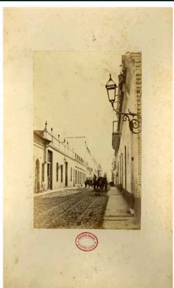
[Calle de La Piedad]