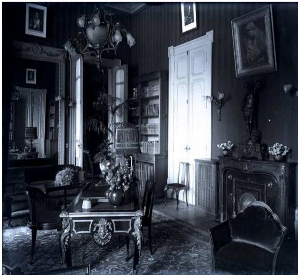
[Casa Rosada. Despacho del secretario de la presidencia]

[Casa Rosada. Despacho del secretario de la