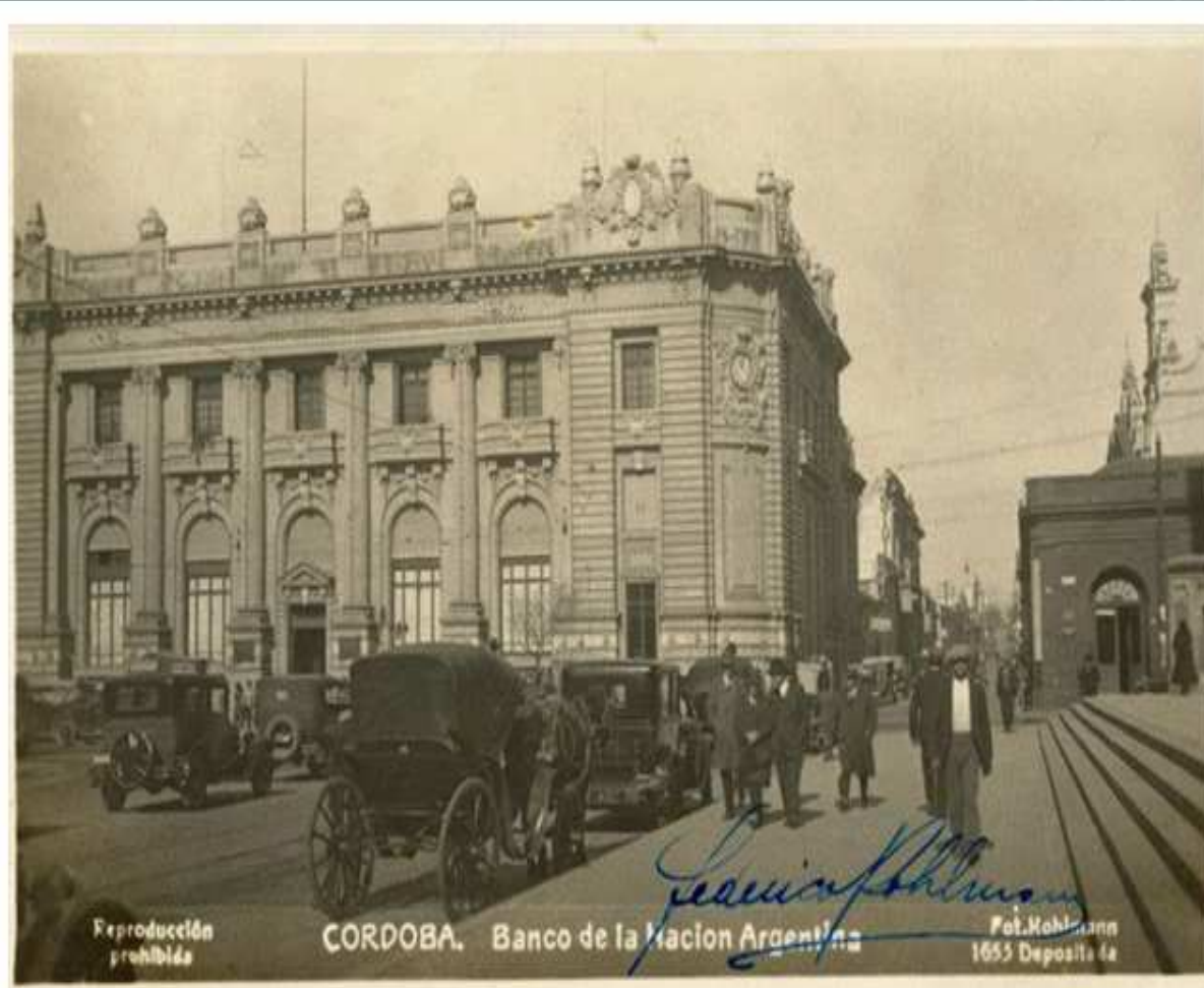
Córdoba. Banco de la Nación Argentina